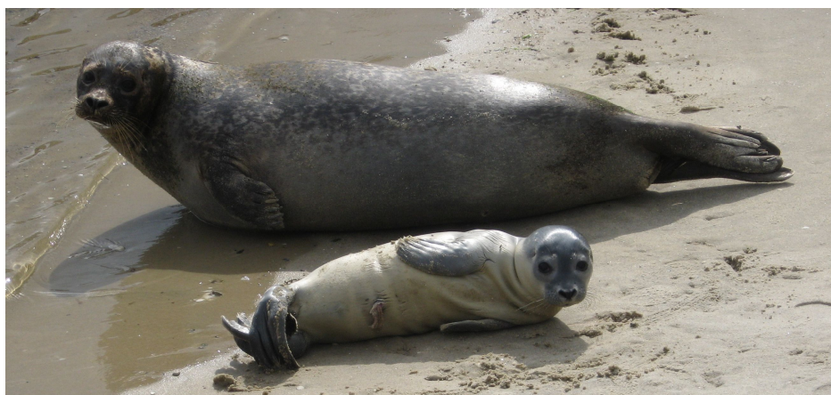
Billedtekst: Sælungen syv dage gammel sammen med mor, Liv på stranden i Kattegatcentrets sælanlæg

Kattegatcentrets sælunge, som blev født den 26. juli er i fuld gang med at opdage verden. Selvom den kun er en uge gammel, er den allerede i fuld gang med at lære verden at kende. Liv er en god mor, og flere gange hver dag søger mor og unge op på stranden, så der kan blive "tanket" næringsrig modermælk.