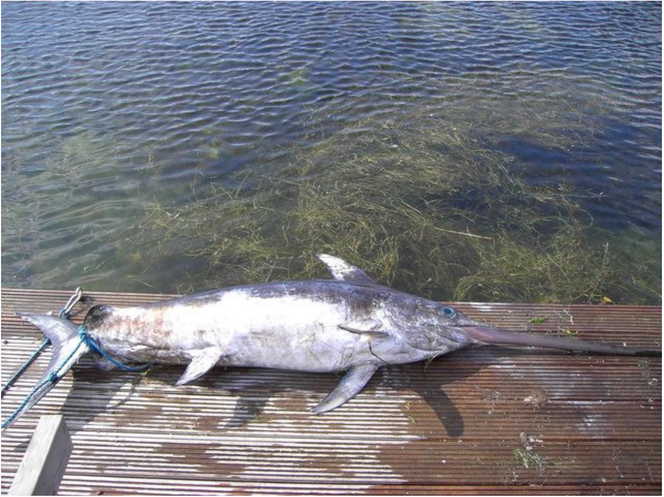
Sværdfisken på kajen i Sakskøbing