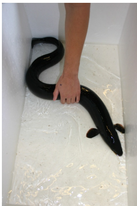
Foto: Kæmpeålen ankommer i transportkasse til Kattegatcentret

Bestanden af den europæiske ål er faldet med 90-95 % gennem de sidste 30 år. Årsagen til den drastiske tilbagegang kendes ikke præcist, men der er bred enighed om, at den hovedsageligt skyldes menneskelig påvirkning bl.a. overfiskeri, forurening samt ødelæggelse af dens levesteder. På baggrund af dette er der i 2007 kommet nye EU regler, der skal begrænse den internationale handel med ål. Ålen er således kommet på den såkaldte CITES (Washington-konventionen) liste II over truede dyr i samme kategori som f.eks. mange skildpadder, papegøjer og kvælerslanger. Derudover arbejdes der i EU regi med særlige forvaltningsplaner, bl.a. med en kraftig reduktion i fiskeriet af ål, som en nødvendighed.