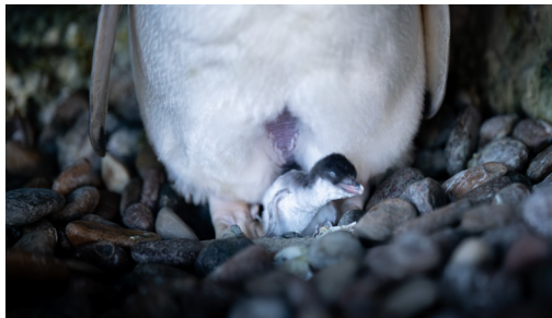
Pingvinungen klækker 1. juli 2025.