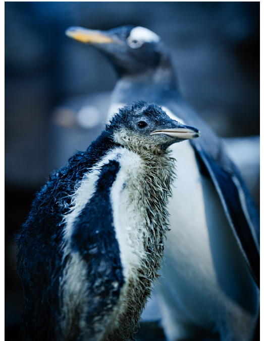
Pingvinungen august 2025.