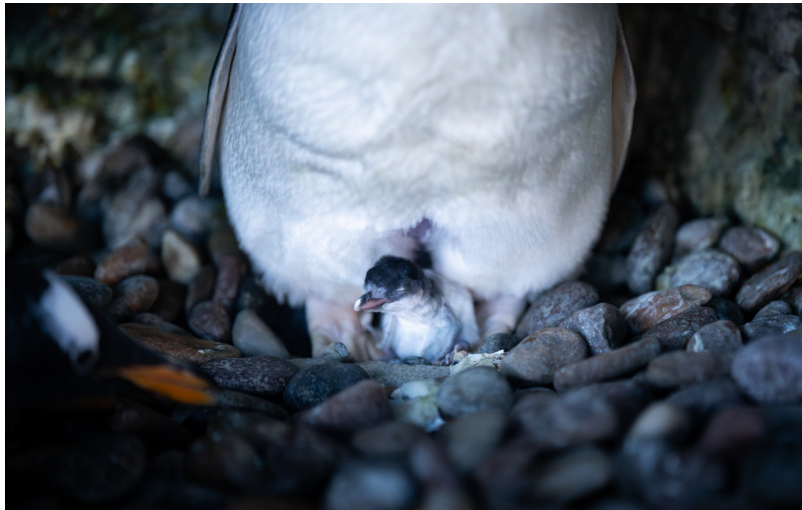
Pingvinungen klækker 1. juli 2025.