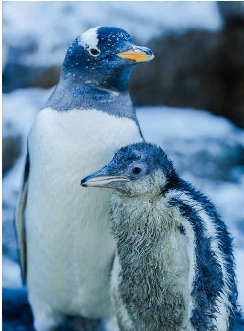
Pingvinungen august 2025.